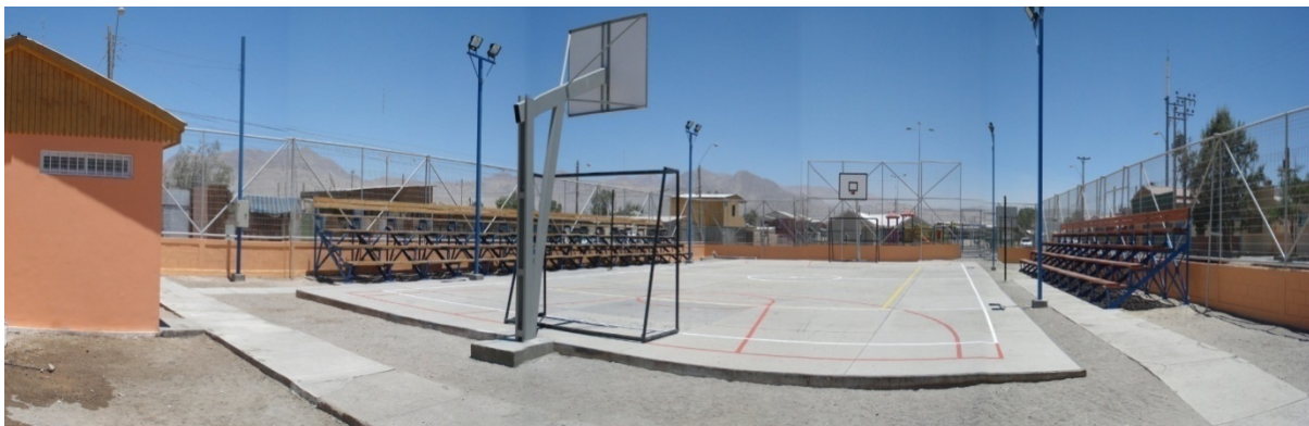
Cuadro N°7 Actividades Masivas Independencia Norte