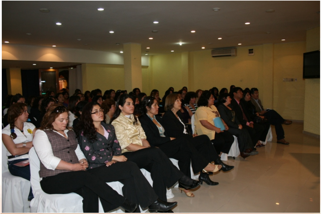
Cuadro N°13 Oficina Municipal de la Mujer