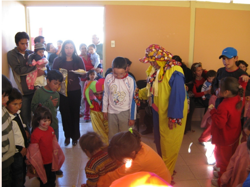
Cuadro N° 23 Oficina Tolerancia Respeto y No Discriminación: