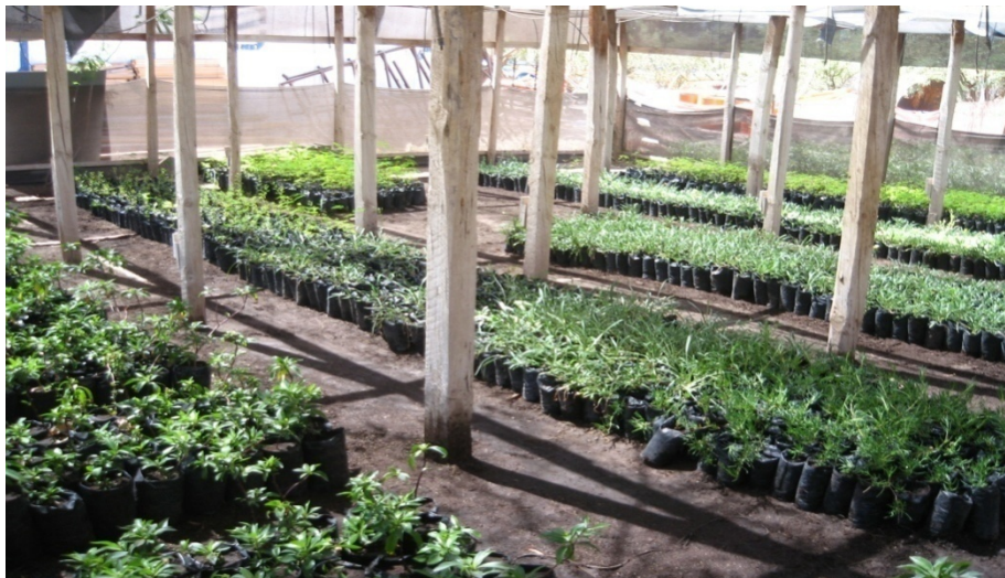
Cuadro N° 10